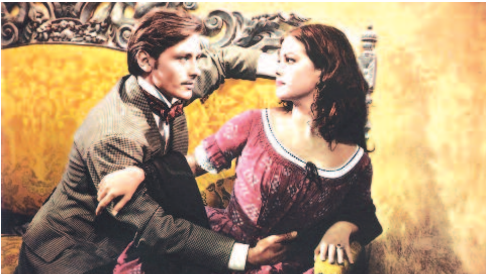
A párdúc. Alain Delon és Claudia Cardinale

Több mint 60 filmet vetítenek a Budapesti Klasszikus Film Maratonon, amelyet szeptember 4. és 9. között második alkalommal rendeznek meg a főváros mellett Egerben és Győrben is. A szervezők közlése szerint a hatnapos esemény kiemelt vendége lesz Claudia Cardinale, Klaus Maria Brandauer és Jean-Marc Barr színész.